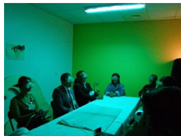
Les moutons rêvent-ils d'androïdes électriques?