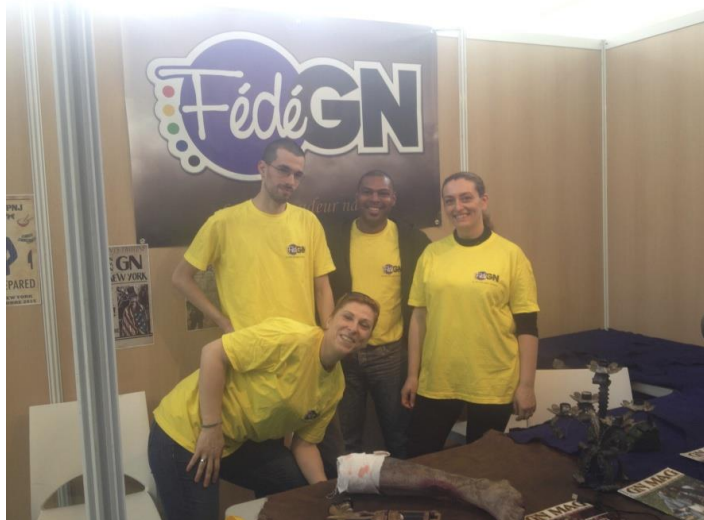
Notre équipe de bénévoles

Cette première intervention de la FédéGN sur ce type d'évènement sur la région est pour nous une réussite, et cela malgré quelques contraintes (nous avons comme support unique la bannière). Bref, le rendez vous est donné pour d'autres salons.