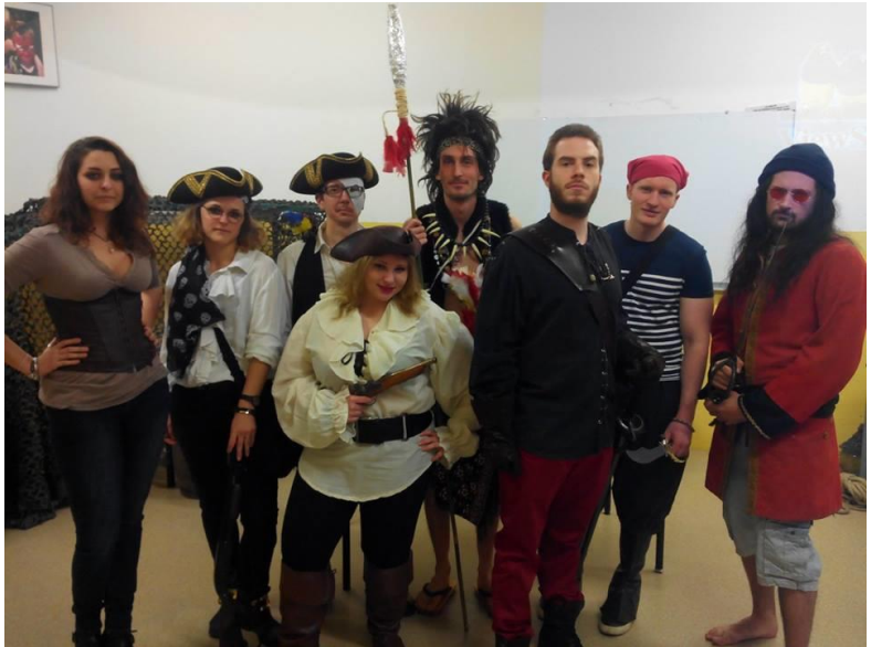
« Un pirate ne meurt jamais »

Encore un grand merci à nos orgas et au chef cuistot qui avait préparé un buffet par thème de jeu!